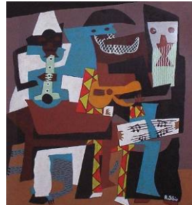
Pablo PICASSO I tre musicisti , 1921