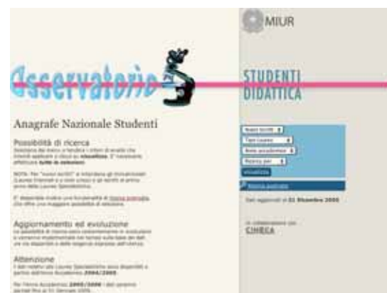
Immagine della home page dell’Anagrafe nazionale degli studenti: indirizzo http://anagrafe.miur.it/

Con l’Anagrafe sarà possibile verificare qual è l’orientamento degli studenti rispetto al gran numero di corsi offerti e si potranno conoscere i successi registrati e le difficoltà incontrate. In questo modo, si potrà disporre di elementi utili per mettere a punto un’offerta didattica adeguata alle esigenze degli studenti, in modo da assicurare a tutti condizioni adeguate a studiare bene e con successo.