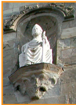
Chiesa di Sant'Agostino - Bergamo